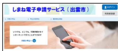
しまね電子申請サービスのサイト