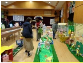
かわとのまちに どうぶつがやってきた