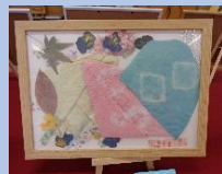
よもぎ、苺、藍の染め物