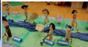
トウモロコシ芯の人形

学級のみんで考えを出し合ってつくりあげた『みらくるエネルギーセンター』、新聞粘土、トウモロコシ人形などを製作しました。