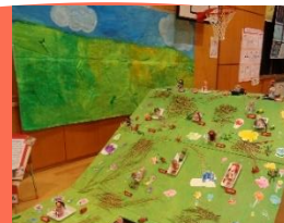
斐伊川土手草すべり