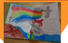
想像性豊かなお話