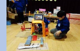
エネルギーセンター