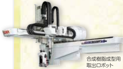
合成樹脂成形用 取出口ロボット

弊社のロボットは、数々の特許技術を取得しており、「操作性」「省エネ機能」「メンテナンス機能」において他社製品より優れています。