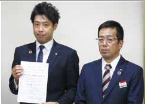
◀左 森山社長 右 成相支店長 ※山陰合同銀行出雲支店に 仲介していただきました。

ガス事業に伴う保安業務及び営業・修理・工事業務において発生するCO 2 排出量について、カーボン・オフセットされました。