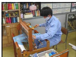
隠岐養護学校・さをり織り作業