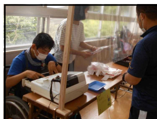
松江清心養護学校・校内販売会