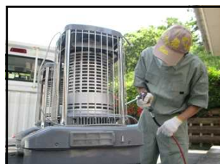
浜田ろう学校・校内作業