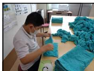
江津清和養護学校・タオルたたみ作業