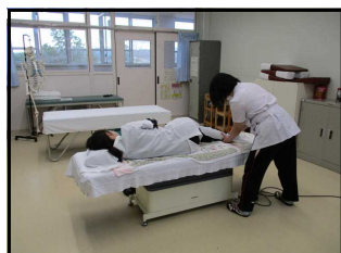
盲学校・施術練習