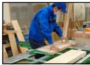
石見養護学校・木工作业