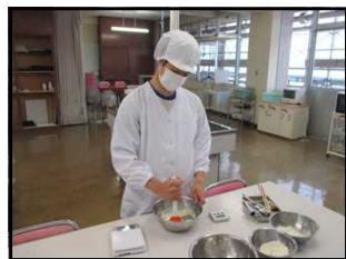
松江ろう学校・製パン作業