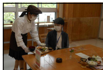
松江養護学校・みのり食堂の営業