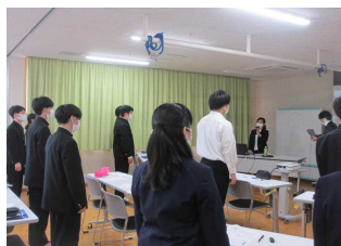
出雲養護学校・接客マナー研修