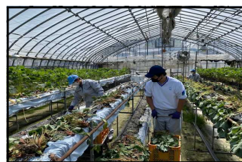
益田養護学校・苺農家との農福連携