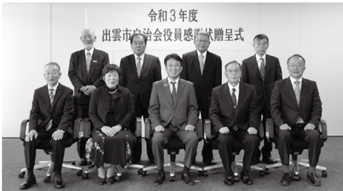
感謝状を贈呈された皆さん