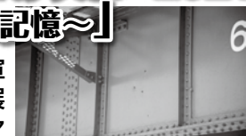
▲段原鉄橋に残る銃弾痕(斐川町直江) 1945年7月28日の米軍機による空襲の爪跡

島根大学と共同で、旧海軍大社基地に関する品々を展示し、戦争当時を知る方々の証言を紹介します。