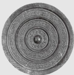
重要文化財 重圏清白銘鏡 (立岩遺跡10号甕棺墓出土)

荒神谷遺跡と同じ頃に、北部九州では「魏志倭人伝」に登場する国々が誕生しました。今回は「不弥国」に比定されている福岡県飯塚市にある立岩遺跡を紹介し、北部九州と出雲の関係性を探ります。