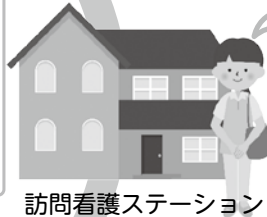
訪問看護ステーション