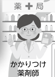
かかりつけ薬剤師