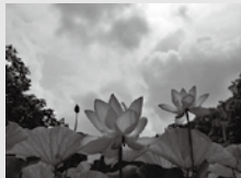
▲荒神谷の古代ハス