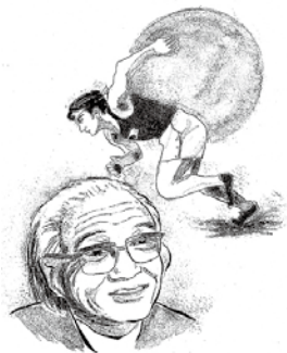
「生涯 走り続けた吉岡隆徳」▶ 辺見じゅん 「暁の超特急 吉岡隆徳ものがたり」より

1932年ロス五輪では日本人最初の100メートルのファイナリスト。しかし、ベルリン五輪では敗北を味わいました。最後まで走り続けた吉岡の生涯を追います。