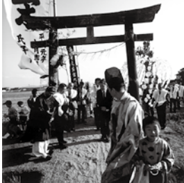
若宮神社の獅子舞▶ (西代町)