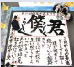
▲書道パフォーマンス

10:00~10:20 出雲商業高校 書道パフォーマンス 10:35~10:50 「子ども獅子舞」三谷神社獅子舞保存会