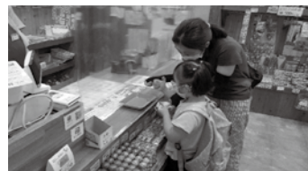
初めての買い物経験で大好きなお菓子を買いました

「終わりはいきなり遊びの終わりを言われても心の準備が…」 「(事後ではなく、事前に予告をする)」