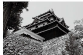
▲国宝 松江城天守