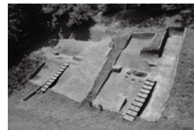
▲国指定史跡 荒神谷遺跡