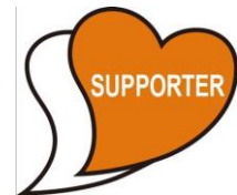
あいサポートマーク