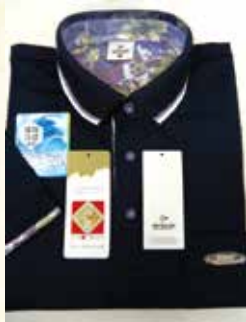
ダンロップ・ポロシャツ