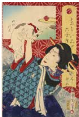
豊原国周 東京三十六会席 明治時代 [出雲文化伝承館]