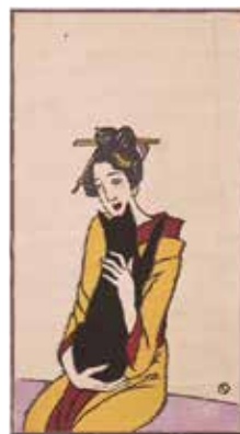
竹久夢二 黒猫を抱く女 柳屋版 大正9年(1920) [平田本陣記念館]

開館時間 / 9:00~17:00 (入館は16:30まで) 休 館 日 / 出雲文化伝承館: 月曜日(祝日の場合は開館)、年末年始 ☎ 21-2460 平田本陣記念館: 火曜日、年末年始 ☎ 62-5090