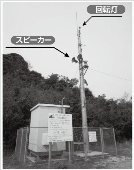
放流警報局 (大津上来原町内)

国土交通省 出雲河川事務所 ☎21-1850 出雲市 建設企画課 ☎21-6561