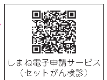
しまね電子申請サービス （セットがん検診）