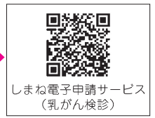
しまね電子申請サービス （乳がん検診）