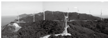
ユーラス新出雲ウインドファーム (株新出雲ウインドファーム) 【3,000kw×26基=78,000kw】