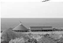
風の子楽習館(市) 太陽光発電【5kw】