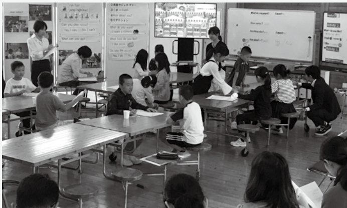
相手の好きな食べ物を英語でインタビューする様子（稗原小学校）

市では、今後も児童が英語に慣れ親しみながらコミュニケーション能力の基礎を養っていけるよう、取り組んでいきます。