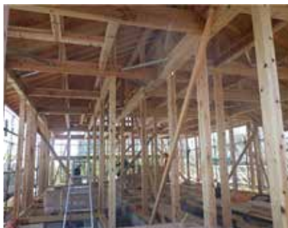
出雲市産の木材を使用した家づくり

家づくりの際に地元産の木材を選ぶことは、出雲市の森にたくましく元気な木々を育て、豊かな森を育むことにも繋がります。