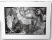
「重なる不思議な世界」参考作品

透明な板に描いていきます。色彩が重なると、少しずつ色が変化していき、そして形となっていく…。そんな不思議な世界を表現することができます。ドロ잉インクがゆっくりと広がっていくのもまた面白いです。じっくりと色が重なっていく不思議な世界を体験してみませんか?