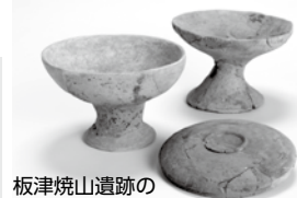
板津焼山遺跡の土器