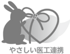
やさしい医工連携

出雲市が島根大学と進めてきた「やさしい医工連携」。 この取組成果を発表し、新たな企業参画や産学官金連携を推進するためのシンポジウムを開催します。