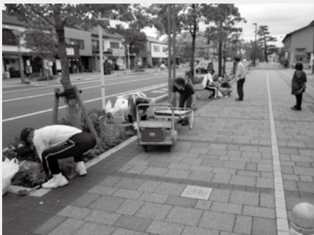
美化サポートクラブ「かめかめ倶楽部」による清掃活動の様子

ごみのポイ捨てや、飼い犬のふんの放置などがない清潔できれいな住みよいまちづくりに協力していただける団体・事業所の皆さんを募集しています。