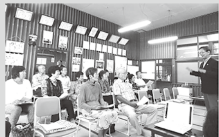
省エネ講座の様子

この省エネ講座を通じ、地球温暖化問題などへの理解を深めていただき、地域・家庭で率先して温室効果ガスの排出抑制や省エネルギーの取組を行う地域づくりをめざします。詳しくは、事務局(環境政策課内)までおたずねください。