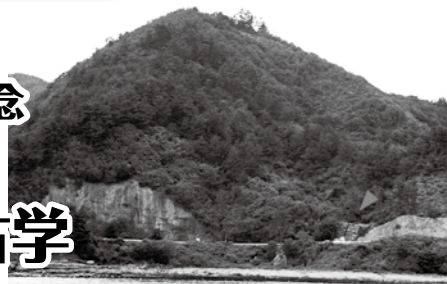
▲ひろげ遺跡の遠景