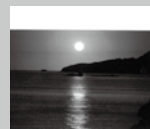
STONE CALENDAR 2018 VOICE OF STONE