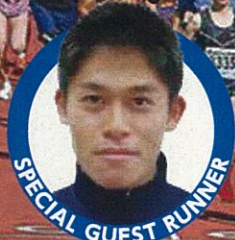
SPECIAL GUEST RUNNER スペシャルゲスト 川内 優輝さん