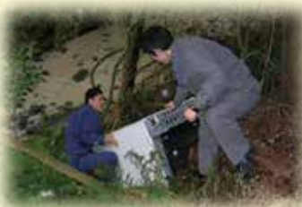
不法投棄された冷蔵庫の回収作業