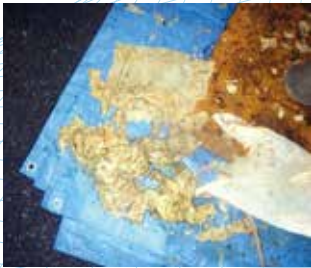
マンホールポンプに詰まっていた布のような物

流すことができるのは、トイレットペーパーだけです。ティッシュペーパー、紙おむつ、生理用品、ウエットティッシュなどは水に溶けないため、絶対に流さないでください。