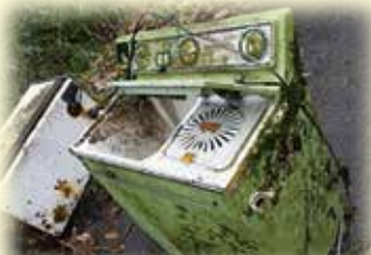
崖下から回収した冷蔵庫と洗濯機

出雲市では、事業者や環境団体の代表者、教育関係者などと「出雲市ポイ捨て禁止推進協議会」を設置し、ポイ捨て禁止啓発キャンペーンや不法投棄防止パトロールなど環境美化の取組を行っています。