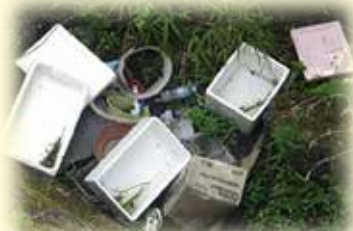
道路下に投げ捨てられた発泡スチロールや段ボールごみ