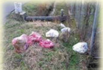
ポイ捨てされた家庭ごみ