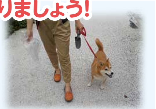
犬の散歩をする時は、フンを処理する道具を持参しましょう。

みんなが気持ちよく過ごせるよう、「犬のフンは放置しない」というルールを守り、飼い主が責任をもって片付けましょう。