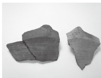
発掘された縄文土器