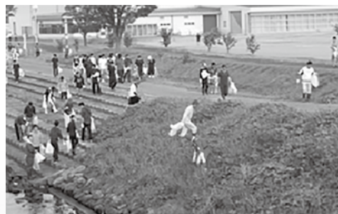
昨年の一斉清掃の様子

ふるさとの貴重な財産である「中海・宍道湖」の自然環境を守り、後世に引き継いでいくため、ご協力をお願いします。