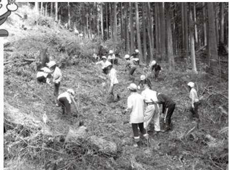
西林木町花田山でのクヌギ植栽 (主催者：川跡共有山林委員会)

市内では、13校の小中学校が緑の少年団として活動し、森林内での野外活動、環境美化活動など、さまざまな取組が行われています。