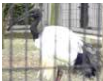
アフリカクロトキ