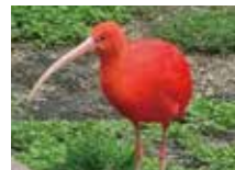
ショウジョウトキ