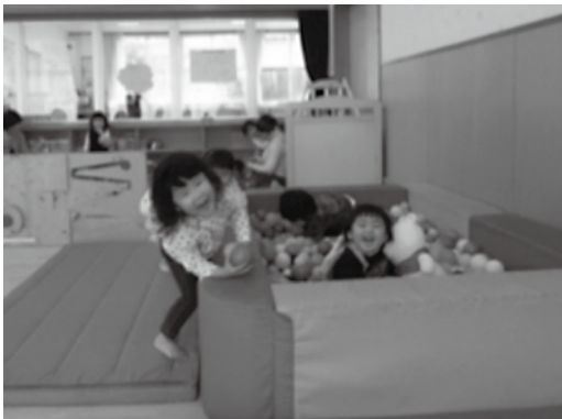
子どもも保護者もリフレッシュできる場所です。(いずも子育て支援センターの様子)

子育て支援センターは、保育士等のスタッフが常駐し、親子が自由に遊びながら、仲間づくりや子育てについての相談をすることができる施設です。