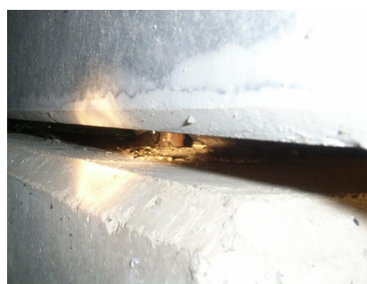
鉛直アンカーバーの腐食（支承）