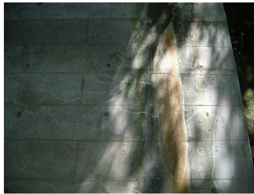
錆汁を伴う遊離石灰、ひび割れ（山側受台）