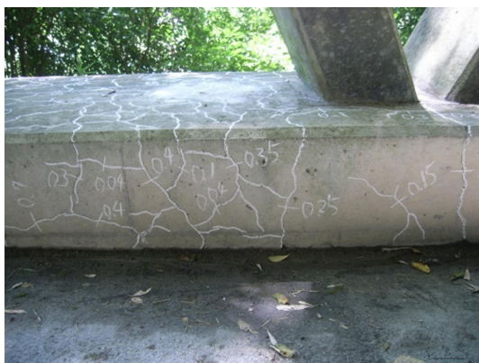
ひび割れ（受台基礎）