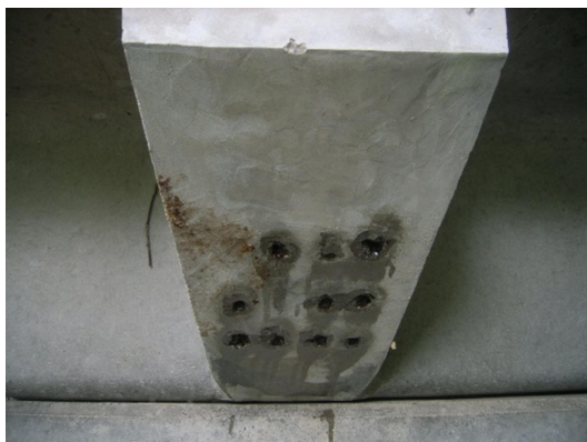
PC 鋼材定着部の鉄筋露出（主梁）