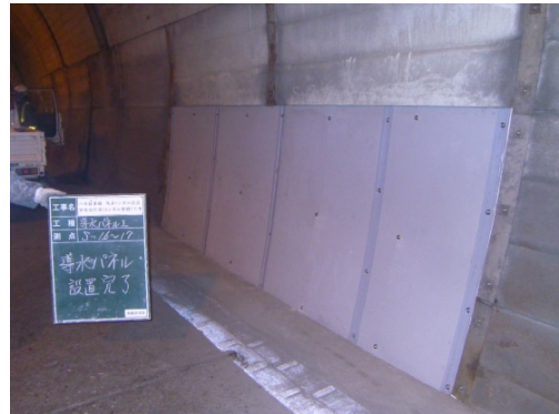
写真 3-3 面導水工