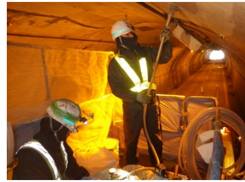
写真 3-4 裏込注入状況