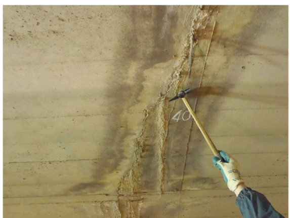
覆工（側壁）のひび割れ・遊離石灰