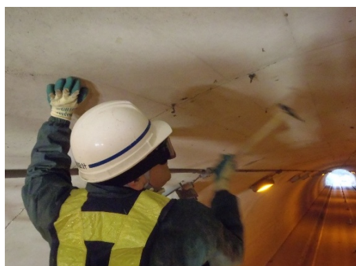
写真 2-1 トンネル点検状況