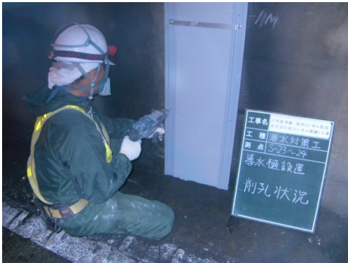
写真 3-2 線導水工