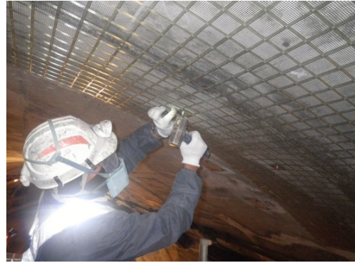
写真 3-1 FRP ネット設置状況