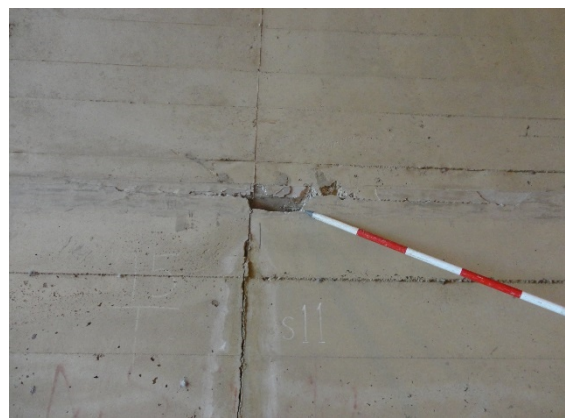
覆工（アーチ）の剥離