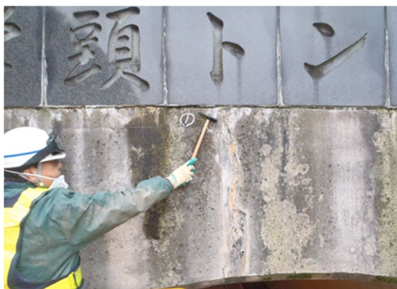
坑門のひび割れ・遊離石灰