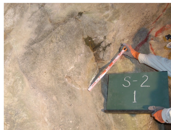
自然岩風化による浮き