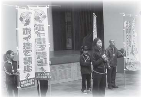
「きれいなまちづくり」を呼びかけるキララスカイのみなさん

ごみのポイ捨てや飼い犬のふんの放置などのない、清潔できれいな住みよいまちづくりを進めるため、道路や公園、河川などで定期的にボランティア活動として啓発活動や美化推進に協力していただける団体や事業所のみなさんを募集しています。