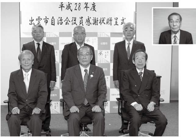
被贈呈者の皆さん

今年度の対象者は、自治協会会長等を通算5年以上した者として6名に市長から感謝状を贈りました。