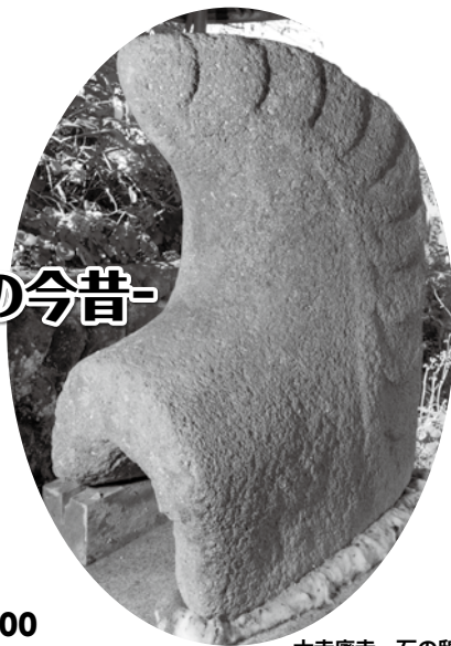
大寺廃寺 石の嶋尾 (鳥取県 伯耆町)