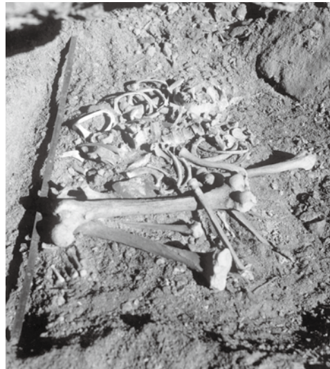
第14人骨(貝輪装着人骨)の出土状況