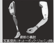
最新の義肢

人の生活を支援する工学技術について、障がい者や高齢者の生活を支援する技術を中心に、その仕組みや最新の動向を紹介いたします。