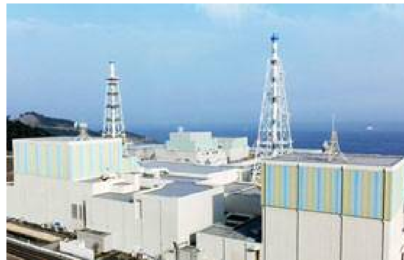
島根原子力発電所1号機(手前右)