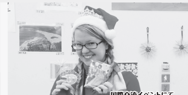
国際交流イベントにて

フィンランドを冬に訪れたいと思うなら、ぜひクリスマスかお正月に来てください。たくさんのイベントがありますので、退屈しないですよ!