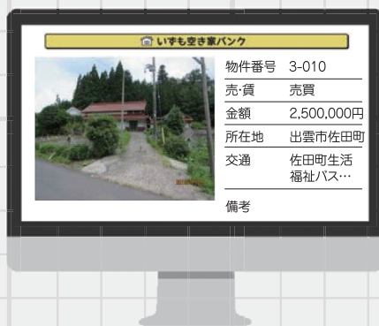
情報提供のイメージ