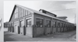
▲旧陸軍歩兵21連隊の訓練施設(浜田市)