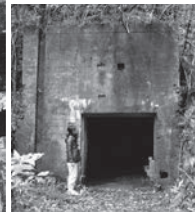
▲基地附属の倉庫壕(斐川)