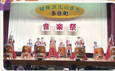
健康文化のまち 多伎町