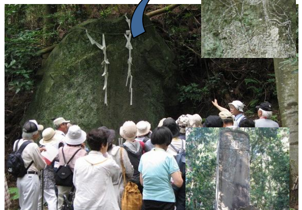
月照寺の大亀(松江)