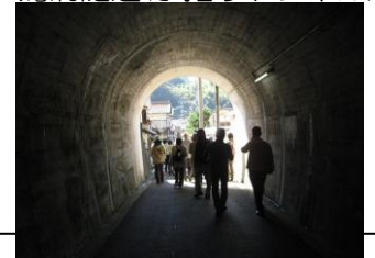
鶺鴒浦隧道(手掘りトンネル)