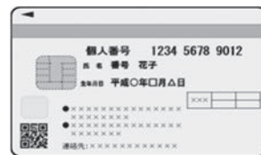
個人番号カード(裏面)イメージ