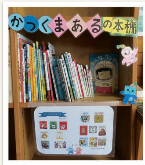
《神西コミセン図書コーナー》