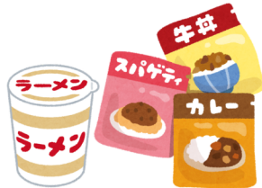
インスタント食品 レトルト食品