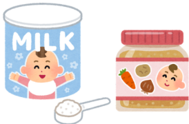
粉ミルク・離乳食