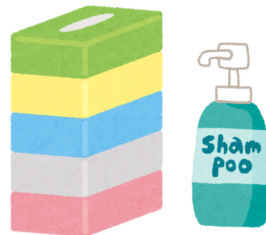
日用品 (ティッシュ、洗剤など)