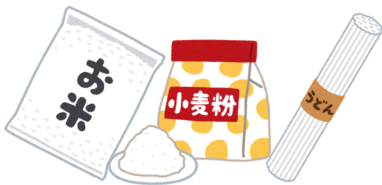
お米・小麦粉・乾麺