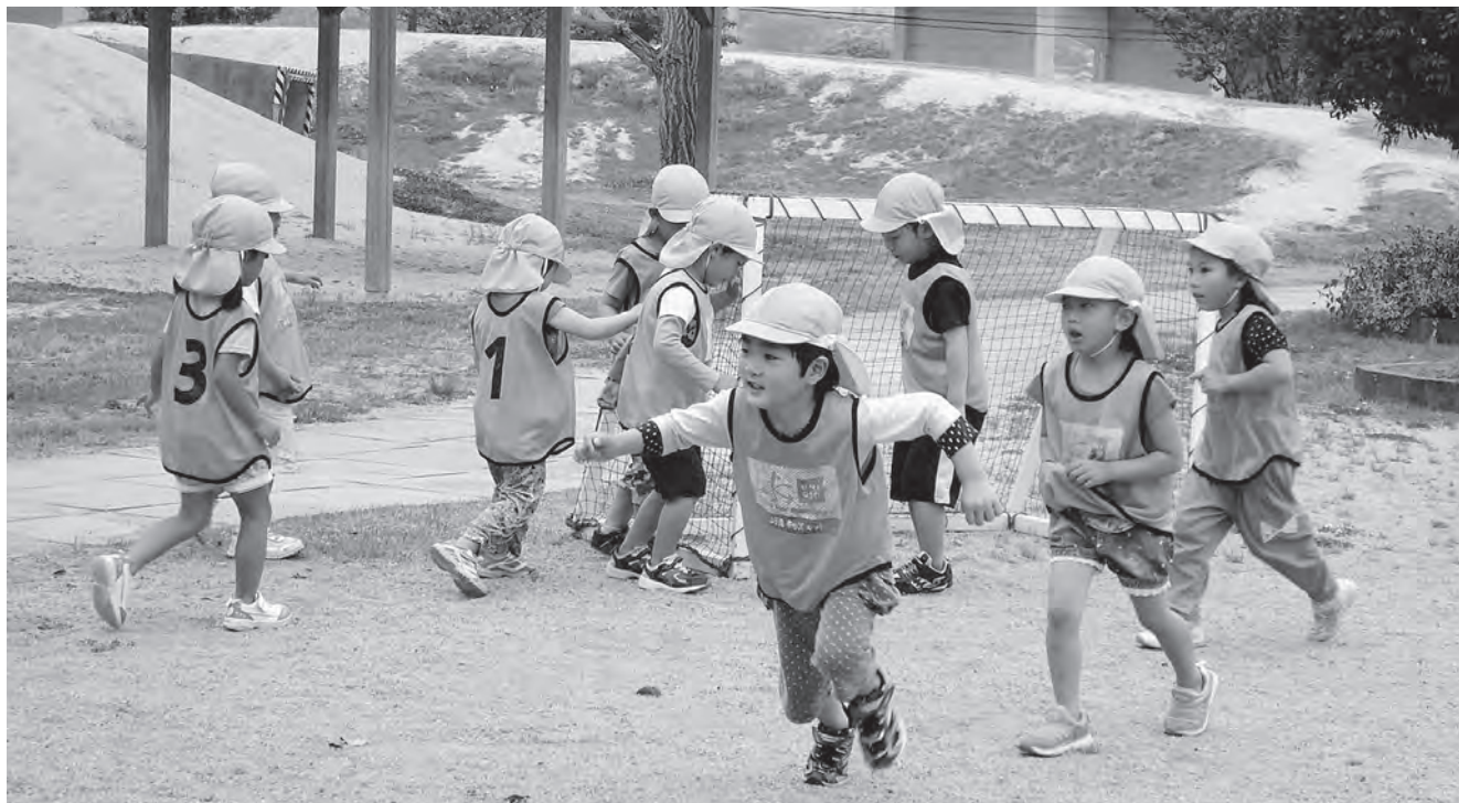
やったー、シュートがきまったぞ。もう1点いれよう。(西野幼稚園)