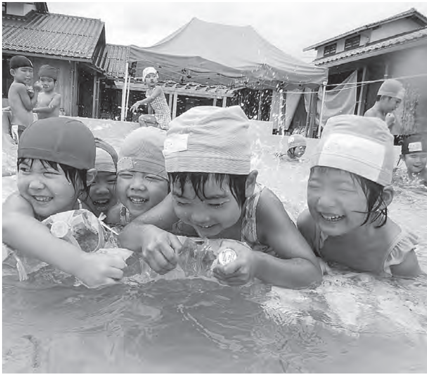
プール遊び楽しいね「いかだに乗ってしゅっぱーつ！」(中部保育所)

平成27年4月にスタート 予定の「子ども・子育て支援 新制度」とは、幼児期の子 どもへの質の高い教育・保育 の提供や、待機児童の解消、 地域の子育て支援の充実を 柱とする総合的な子育て支 援制度です。 新制度では、保育料の仕組 みなどが変わります。また、 手続きなどは、次の各施設 の内容でご確認ください。