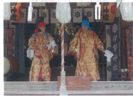
6年生の2人は緊張の初舞台でした