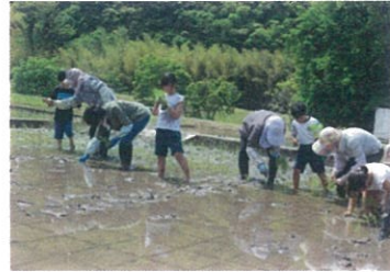
ばってんのところに植えます