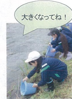
〈神戸川漁協乙立支部〉