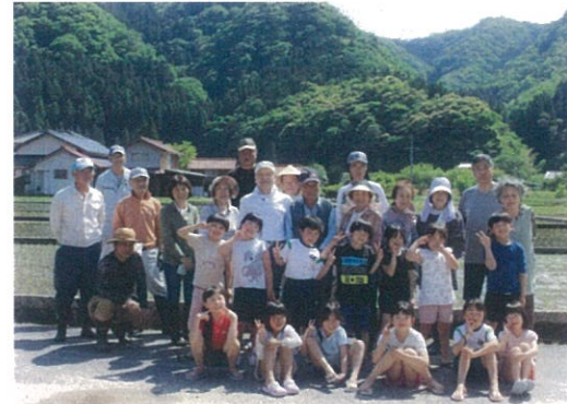
最後にみんなで記念写真