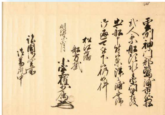
輪島屋文書「船の通行手形」