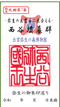
御朱印 (西谷弥生国王印影)