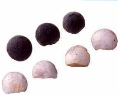
奈良時代の平玉(松江市・岩屋遺跡) (島根県埋蔵文化財調査センター蔵)

囲碁や将棋はいずれも東アジアを経由して日本に伝わっており、海を越えた人びとの交流がボードゲームを通して分かるのです。