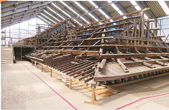
保存修理工事の様子（屋根材解体）

★旧大社駅保存修理事業 「保存修理後の姿は？」 旧大社駅保存修理事業は、令和4年度で3年目を迎えました。解体工事はほぼ終了し、建物の破損状況や建物の歴史が明らかになってきました。 建造物は建築された時点から、様々な手が加えられる運命にあります。国宝や重要文化財もその例外ではなく、旧大社駅においても、様々な改築がみられました。今回の解体修理にともなう調査結果をもとに、解体された部材や古写真などの史料を参考にしながら、建設された大正13年に近い「昭和初