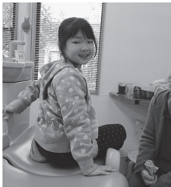
「お口の中、きれいにしてもらったよ！」とにっこり笑顔。

「歯医者ってどんなところ？」って聞かれたらあなたはどうか答えられますか。それは皆さんの経験に基づくものですが、さまざまな答えがあると思います。 では、また歯医者に行ったことのない子どもたちと同じ質問をしたら、どんな答えが返ってくるでしょうか。もし、あなたの周りにそんな子がいるのなら、ぜひ聞いてみてください。そこで、「好き・楽しい」