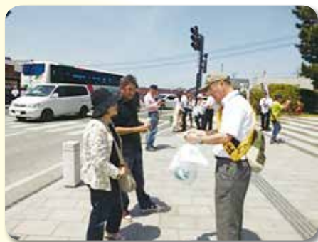
出雲大社勢溜でのキャンペーン活動