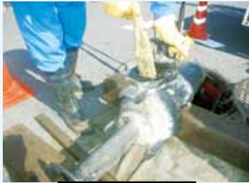
マンホールからポンプを引き上げ、詰まっていたタオルを取り出しました。

下水処理場の運転や下水道管の補修などの維持管理費は、皆さんの下水道使用料でまかなわれています。一人ひとりが十分に注意して正しく使いましょう。