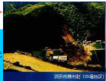
浜田市穂出町(中場地区)

土砂災害はほとんどが、100年ぐらい災害が起きていないところで起きました。1983年に浜田市では、安全だと思ってた避難した家の後ろの山が崩れました。15人がなくなりました。