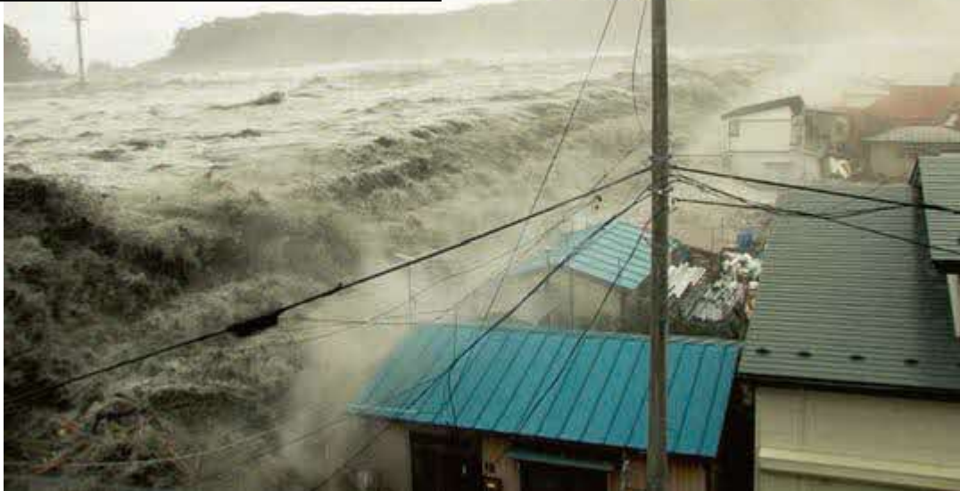
Tsunami avança o dique e chega na cidade.

Para se proteger de tsunami é necessário estar preparado e se refugiar rapidamente.