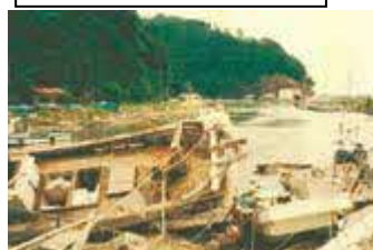
Danos nos barcos causado pelo tsunami.

O terremoto que ocorreu em maio de 1983, de magnitude 7.7, próximo do mar da província de Akita causaram o tsunami, provocando inundações nas casas e danos nos barcos da região de Oki na península de Shimane.