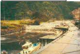
Tsunami avançando o rio.