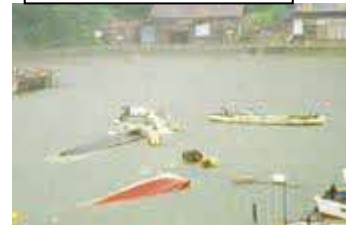
Danos nos barcos causado pelo tsunami.

O terremoto que ocorreu em julho de 1993, de magnitude 7.8, próximo de Hokkaido causaram o tsunami, provocando inundações nas casas, danos nos arrozais, plantações e barcos pesqueiros da região de Oki na península de Shimane.